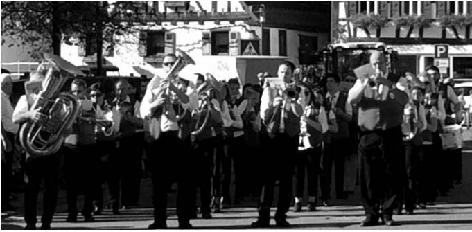
Weitere Informationen und Bilder vom Kerweumzug finden sie auf: www.musikverein-meckesheim.de oder auf https://www.facebook.com/Musikverein-Meckesheim-eV