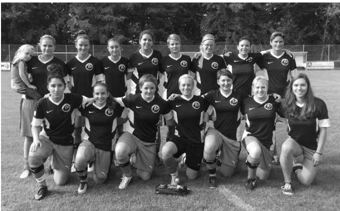
Die Damenmannschaft bedankt sich bei der Fa. Heinrich Diezel Flachdachbau für die gesponserten Warmmach-Shirts!